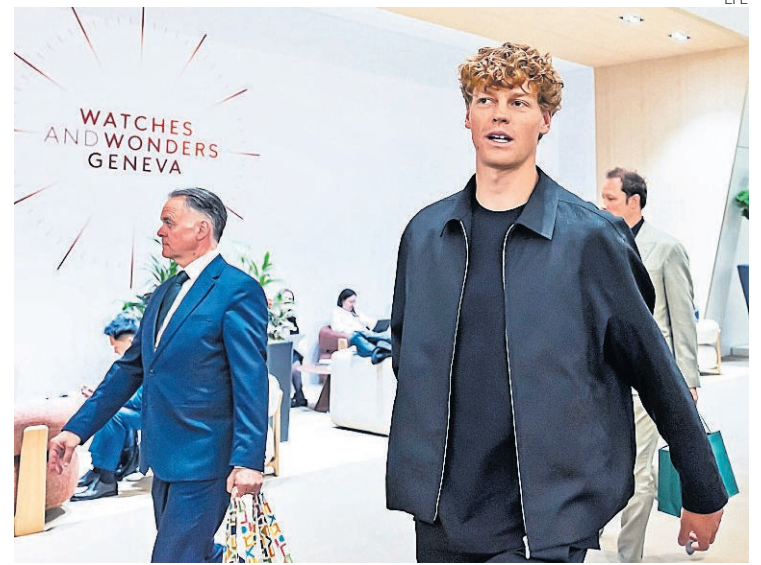
► Jannik Sinner (d) cuando visitó el stand de Rolex en la jornada inaugural de la feria de relojes de lujo 'Watches and Wonders Geneva', en Ginebra, el 14 de abril pasado.

sión en el hombro a mediados de marzo en Indian Wells, Djokovic (4.º) tampoco participará. Mientras que Sinner podría encontrarse en semifinales con